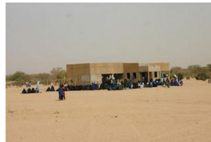
Infermeria a Tindawene

Vuole diventare un esperto di malnutrizione e aprire un Centro di lotta alla fame nel deserto tra le località di Agadez, Marradi e Zinder; quello definito il triangolo della fame.